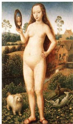
Tavola IX - "Vanità" (olio su tavola di Hans Memling, 1485) 20

Ma a quale prezzo le donne rincorrevano quel modello di bellezza?