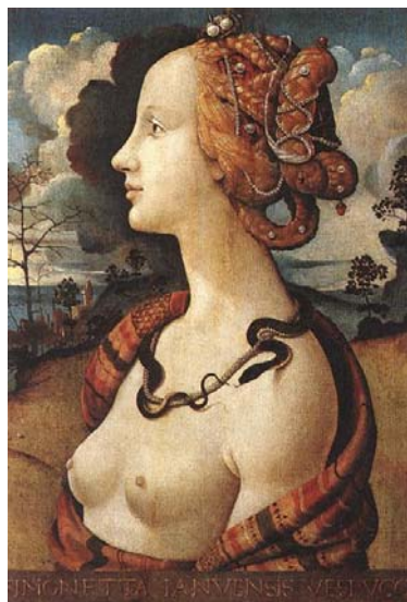
Tavola VII - "Ritratto di Simonetta Vespucci" (Olio su tavola di Piero di Cosimo, 1480) 18