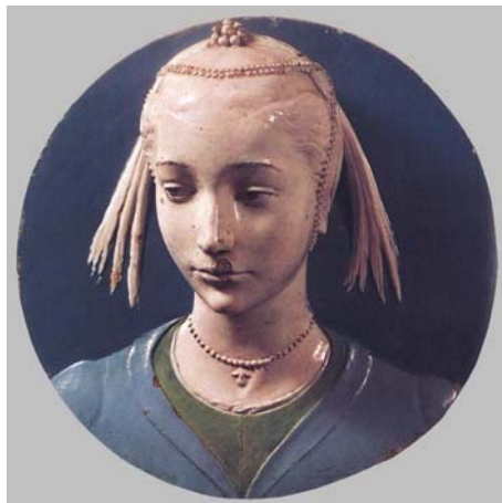
Tavola V - "Ritratto di signora" (tondo in ceramica di Luca Della Robbia, 1465) 16