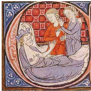
Tavola II - Miniatura su pergamena, tratta dalla Bibbia di Hainburg (1300-20) 13