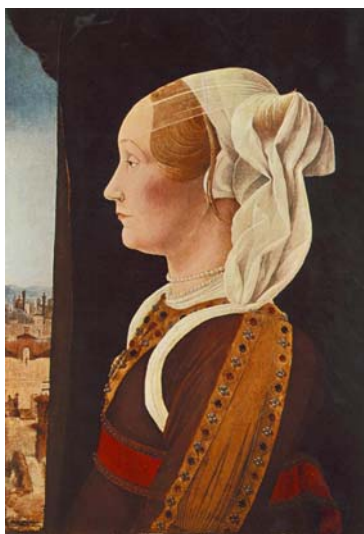
Tavola VI - "Ritratto di Ginevra Bentivoglio" (olio su tavola di Ercole de' Roberti, 1480) 17