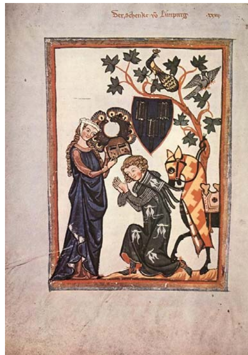
Tavola III - miniatura su pergamena (Zurigo, 1300-20) 14