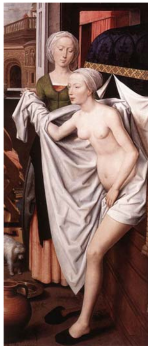
Tavola VIII - "Bathsheba" (olio su tavola di Hans Memling, 1485) 19