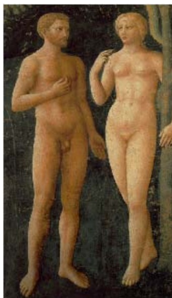
Tavola IV - “La tentazione” (affresco di Masolino da Panicale, 1426-27) 15